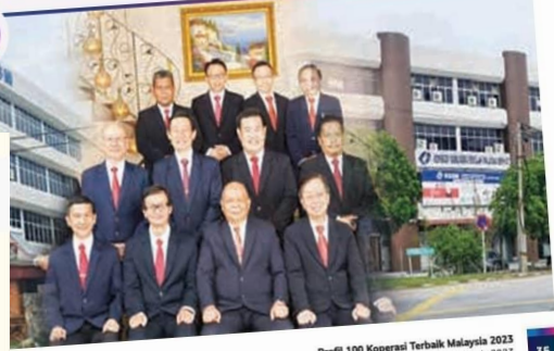
Profil 100 Koperasi Terbaik Malaysia 2023 Top 100 Co-operatives in Malaysia 2023